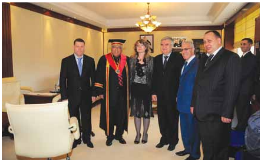
На вручении академику А. Пашаеву научного звания – Почетного доктора Одесской академии связи и Почетного члена Азербайджанской диаспоры в Украине