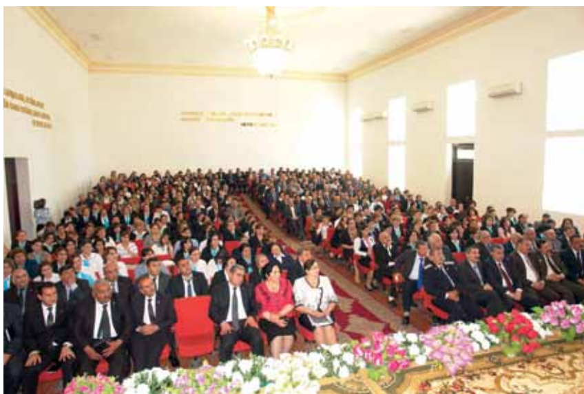
Отчет перед земляками в честь 90-летия Гейдара Алиева, май 2013 г.