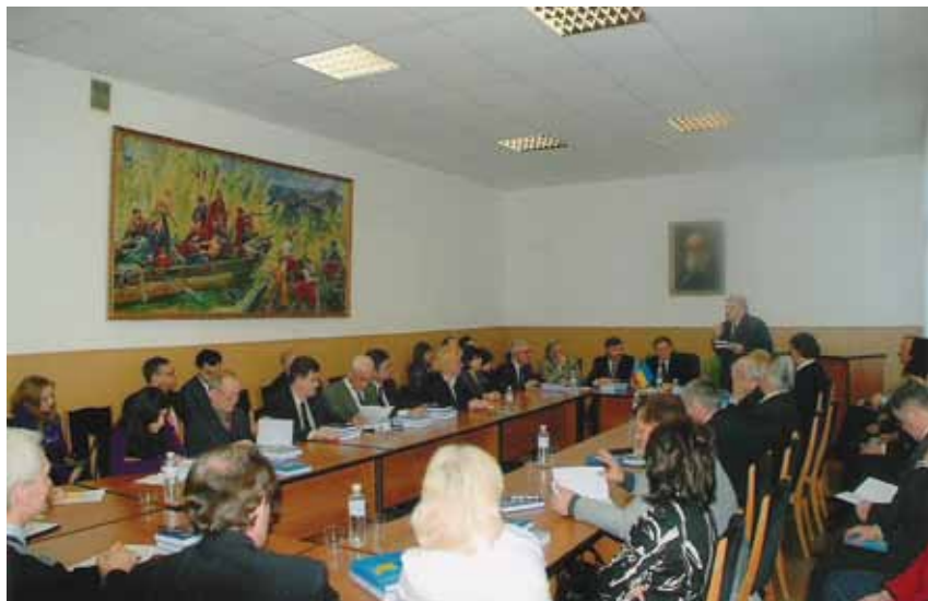
Зал Ученого совета Института истории Национальной академии наук (во время презентации)