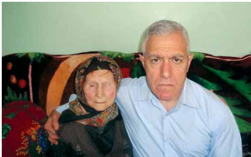
Последняя встреча с мамой