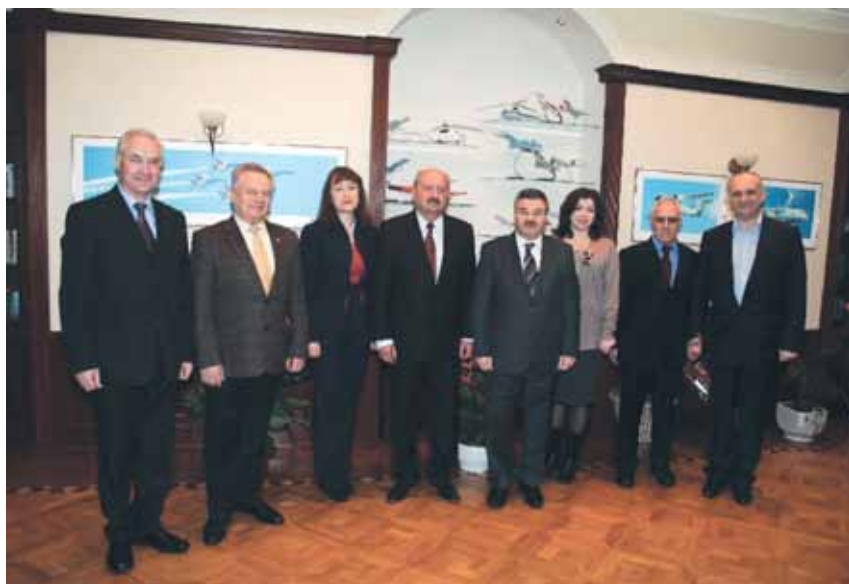
С руководством Национального авиационного университета