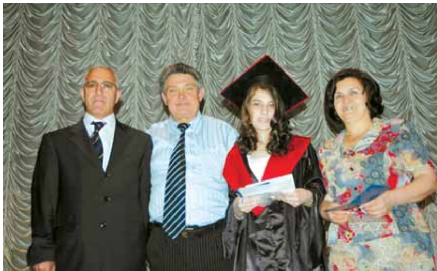
Дочь Конуль получает диплом врача