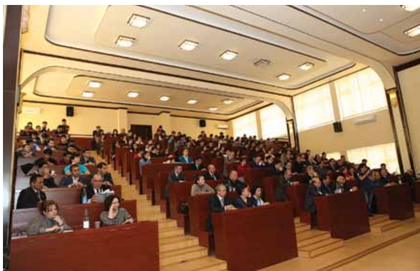
На презентации монографии. Отчет перед родным университетом спустя 35 лет