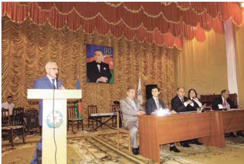
Выступление перед общественностью Бардинского района Азербайджана, где жил и работал до 1998 г.