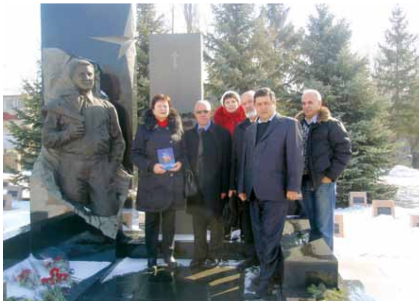
Возле памятника Евгения Кушнера (презентация родным монографии, посвященной 60-летию Е. Кушнера)