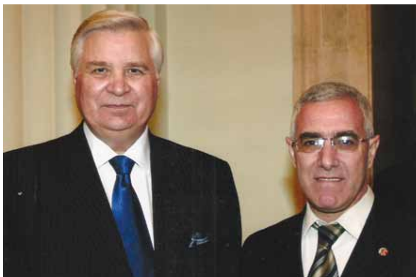
Встреча с Министром иностранных дел Украины Анатолием Зленко