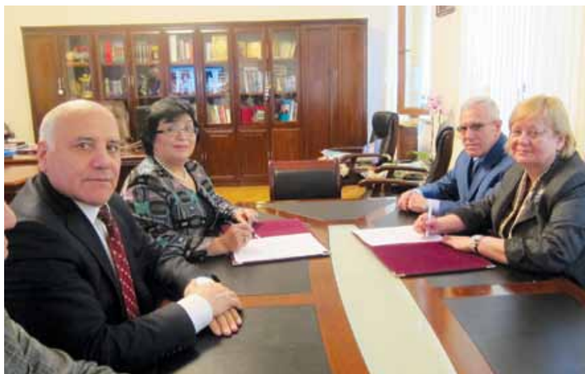
Подписание соглашения о сотрудничестве между Бакинским и Киевским управлением образования, 30 январь 2011г.