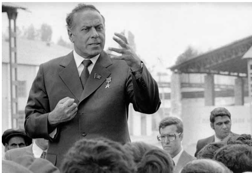
Встреча с Гейдаром Алиевым (Бардинский хлопкоочистительный завод, сентябрь 1980 г.)