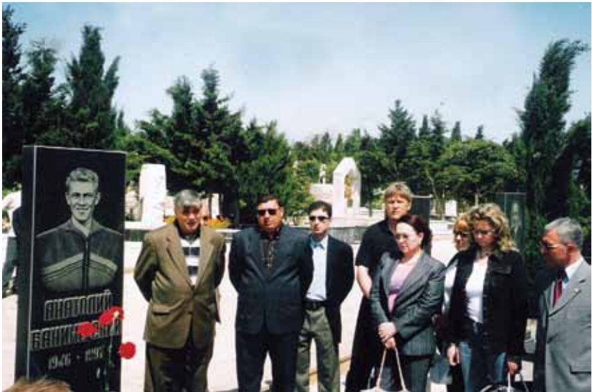
У могилы известного футболиста Анатолия Банишевского во время встречи ветеранов «Нефтчи» Баку и «Динамо» Киев, 2003 г.