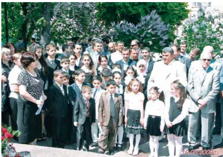
В день рождения Гейдара Алиева. Юные украинские азербайджанцы вместе с родителями на территории Посольства Азербайджана в Украине